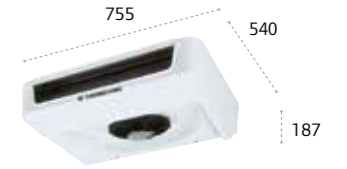
ES150 MAX ultraplano