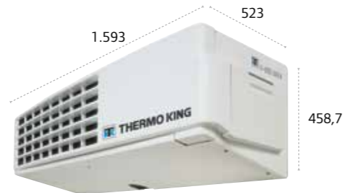
V-800/V-800 MAX/V-800 MAX Spectrum