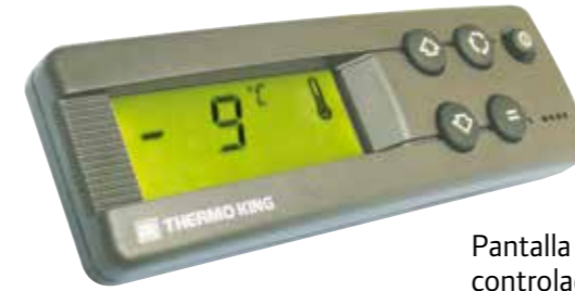
Pantalla en cabina del controlador DSR