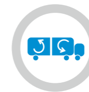
Rango del punto de consigna ajustable para cada compartimento