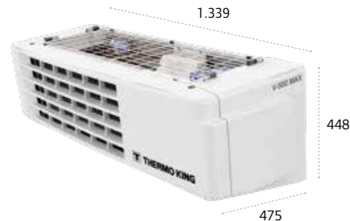
V-500/V-500 MAX/ V-600 MAX/V-500 MAX Spectrum