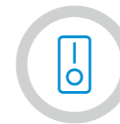
Encendido/apagado de cada compartimento