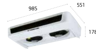
ES300/ES300 MAX ultraplano