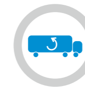
Monotemperatura, en caso necesario